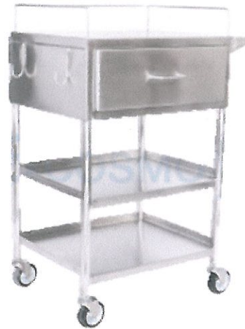
รูปประกอบที่ 6