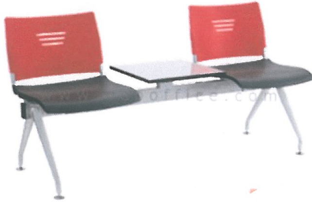
รูปประกอบที่ 4