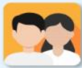
ผู้กู้ยืมเงินรายใหม่

* ให้ผู้กู้ยืมเงินที่ผ่านการอนุมัติ เปิดบัญชีเงินฝากกับสถาบันการเงินหรือนิติบุคคลที่กองทุนกำหนด ปัจจุบัน ได้แก่ บมจ.ธนาคารกรุงไทย และธนาคารอิสลามแห่งประเทศไทย เพื่อรับการโอนเงินค่าครองชีพรายเดือน