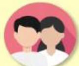
ผู้กู้ยืมเงินรายเก่าเปลี่ยนระดับ/ ย้ายสถานศึกษา/เปลี่ยนหลักสูตร หรือสาขาวิชา