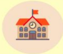
สถานศึกษา